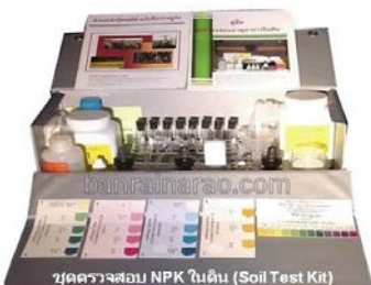
ชุดตรวจสอบปริมาณ N-P-K ในดิน

3. นำดินทั้ง 15 จุดมาผสมเคล้ากัน จากนั้นแบ่งเป็น 4 ส่วน และเก็บตัวอย่างดิน 1 ส่วน ประมาณครึ่ง กิโลกรัม นำไปวิเคราะห์หาธาตุอาหาร N-P-K